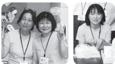
▲笑顔がステキなケアマネさん