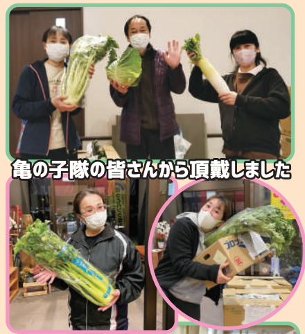
亀の子隊の皆さんから頂戴しました