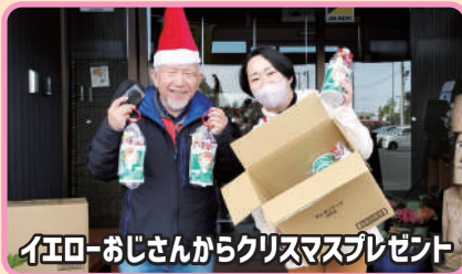
イエローおじさんからクリスマスプレゼント