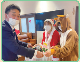
新みやぎ農業協同組合様から