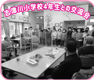
志津川小学校4年生との交流会