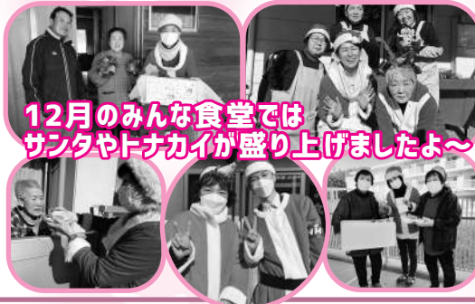
12月のみんな食堂では サンタやトナカイが盛り上げましたよ～