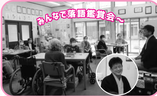
みんなで落語鑑賞会～