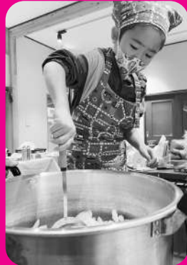
牛乳パックは万能だね〜 工夫次第で便利だよ

町の防災訓練に合わせ、結の里では防災への学びを深めるための大人と子ども合同キッキングを行いました。個々に持ち寄った野菜を合わせカレー作り、ビニール袋に入れたお米を熱湯に投入すると…！お皿やスプーンが無い時はどうする？ 代用したり作ったり、知恵をフル回転させて食べたカレーライスの味は最高でしたね。