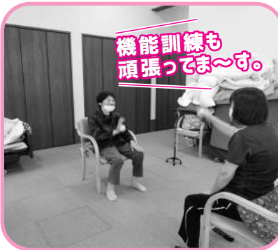
機能訓練も 頑張ってます。

地域密着型デイサービスセンターです。月曜から土曜まで運営しています。結の里の中にあり、常に地域の方々と触れ合い交流ができる楽しみがあります。