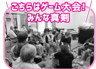
こちらはゲーム大会! みんな真剣

地域密着型デイサービスセンターです。月曜から土曜まで運営しています。結の里の中にあり、常に地域の方々と触れ合い交流ができる楽しみがあります。