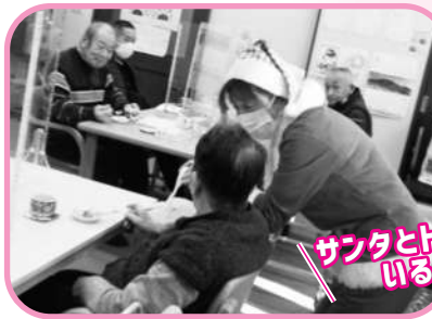
サンタとトナカイも いるのね