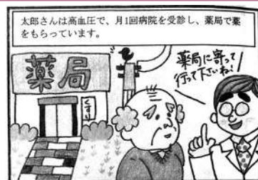
太郎さんは高血圧で、月1回病院を受診し、薬局で薬をもらっています。

地域で元気に“イキイキ”生活している方を大募集! 男女問いませんので、是非ご紹介下さい! ♥