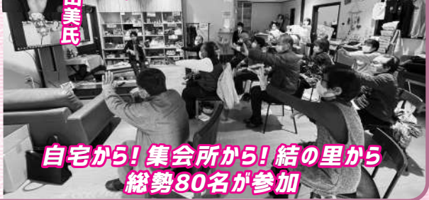
自宅から! 集会所から! 結の里から 総勢80名が参加