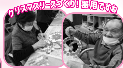
クリスマスリースづくり! 器用ですね