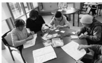
趣味活動：裁縫 雑巾を縫ったり、牛乳パックの鍋敷きを作成しています。

みやぎ心のケアセンターの皆様にご協力を賜り実施することが出来ました。ご協力大変有難うございました。