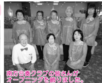
南方合奏クラブの皆さんがオープニングを飾りました。