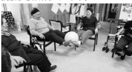
下肢の運動：ボール渡し ※春にはプランター畑で花々や野菜作りを行います。