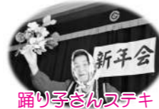
踊り子さんステキ

新年最初の開校日には、新年会を行いました。歌津ではみなさんお得意の踊りの披露やカラオケ、志津川では開校日が1月10日(110番の日)ということで南三陸警察署よりその隊の皆さんの寸劇を見ながら、振り込め詐欺について学んだり、ピンゴ大会で盛り上がりましたよ～☆