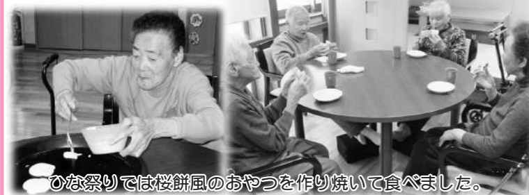
ひな祭りでは桜餅風のおやつを作り焼いて食べました。