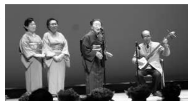
ありがとうございました

ご出演していただいた皆様、ご参加いただいた皆様、そしてほっとバンクボランティアのメンバー、ありがとうございました。