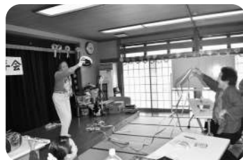
足で新聞折りに挑戦!!