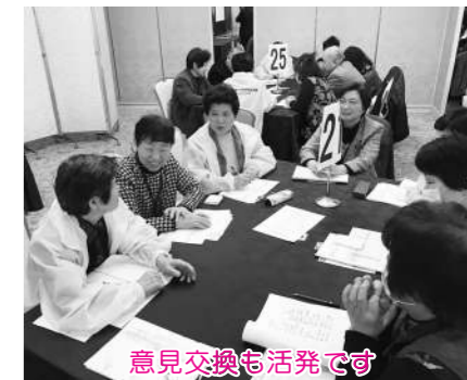
意見交換も活発です

3月6日(月)迫町を会場にボランティア交流会が開催され南三陸町からほっとバンクメンバー30名が参加し日頃の活動の取り組みや思いについて、他地域の方々と意見を交わして来ました。会場を沸かせた「長生き坂音頭」♪では、全員がひとつになり、アンコールで盛り上がりました。