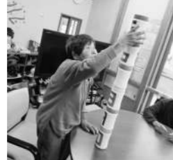
上肢の運動：缶積み