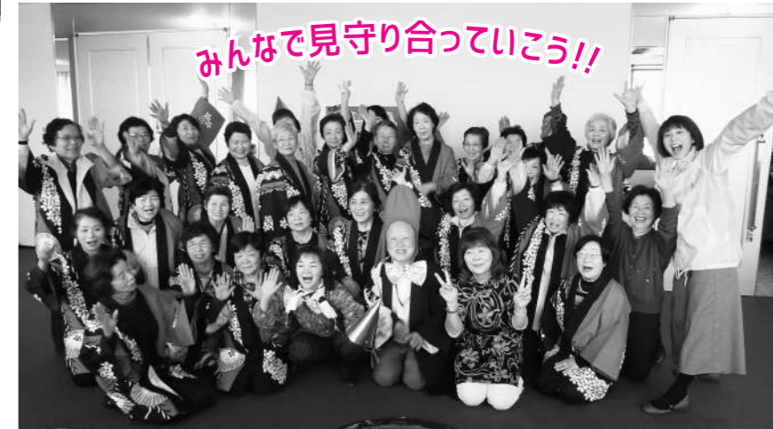
みんなで見守り合っていこう!!

現在メンバーは110名。お互いの見守りを通して地域を盛り上げて頂ける方を募集中です!!