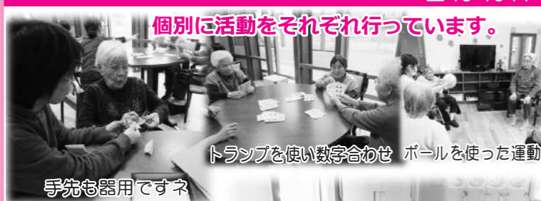
個別に活動をそれぞれ行っています。