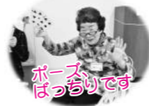
ポーズばっちりです