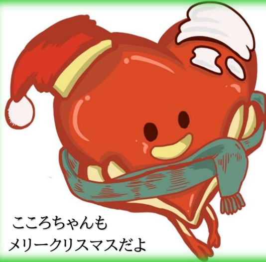
こころちゃんも メリークリスマスだよ